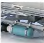
Держатель кислородного баллона 5 кг 100005870