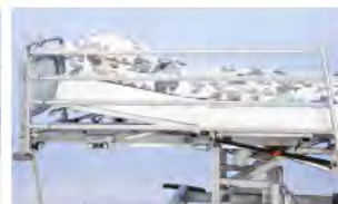
Боковое ограждение длина ¾ A42999900