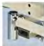
Адаптер для рукоятки/кнопки и держателя пульта управления A43033900