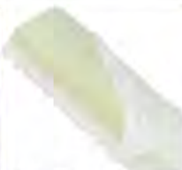
Mediform 2000 x 800 x 130 100000964