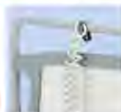
Крюк для электрокабеля A41987307