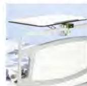
Столешница для монитора / журналов 128009769