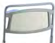
Складной торец кровати 85 см A42179900