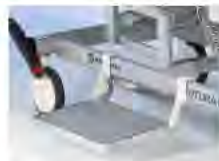
Ступень (только для кроватей с фиксированной высотой) 100000760