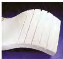
Mediflex 2000 x 800 x 130 100000942