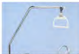
Устройство со скатывающейся вверх треугольной рукояткой для приподнятия пациента A41884100 Адаптер A42193400