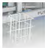
Держатель мочеприемной бутылки 128009790