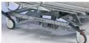
Боковая корзина для установки на нижнюю раму A41955500