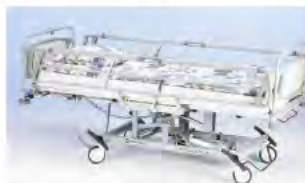
Односекционные складные боковые ограждения A41974400