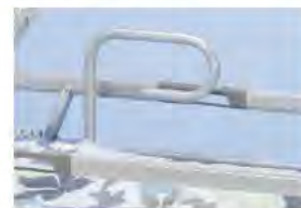
Рукоятка-клюка, съемная опорная рукоятка для самостоятельного подъема пациента с кровати A41842500 Адаптер A43033900