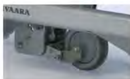
Опция: пятое колесо A43036200